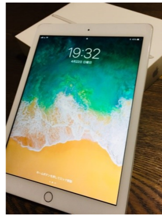
西 郁子 (獣医師)

ディズニーが大好きでよくお休みを頂いてディズニーに行っています♪ お休みを頂くとスタッフから「ディズニー行くん？」と聞かれるくらい行っています！ (笑)今年でディズニーが35周年でそのパレードが見たくて最近も行ってきました！ ディズニーキャラクター達に癒されて、powerを貰い、また明日からもがんばろう！ と思わせてくれる良き場所です。