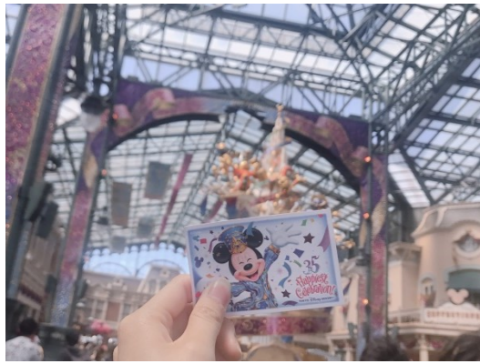
熊野 李咲 (動物看護師)

ディズニーが大好きでよくお休みを頂いてディズニーに行っています♪ お休みを頂くとスタッフから「ディズニー行くん？」と聞かれるくらい行っています！ (笑)今年でディズニーが35周年でそのパレードが見たくて最近も行ってきました！ ディズニーキャラクター達に癒されて、powerを貰い、また明日からもがんばろう！ と思わせてくれる良き場所です。